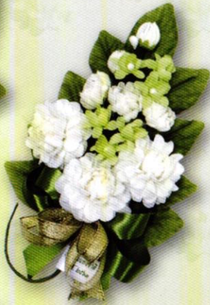
3 ช่อมะลิ "ร้อยรวมรัก" ราคา 50.- บาท